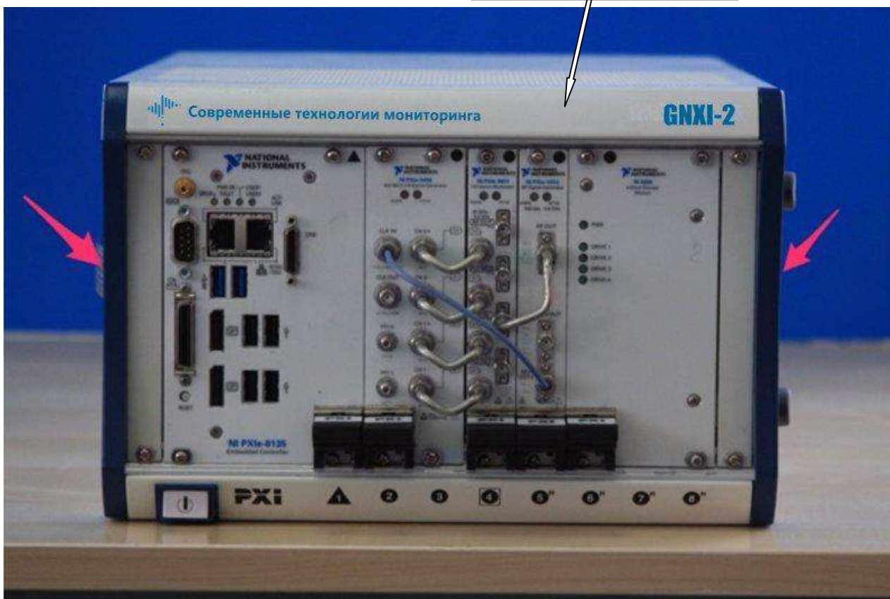
Рисунок 3 - Внешний вид имитатора GNXI-2 и места пломбировки от несанкционированного доступа и нанесения знака об утверждении типа (красные стрелки - место пломбировки)