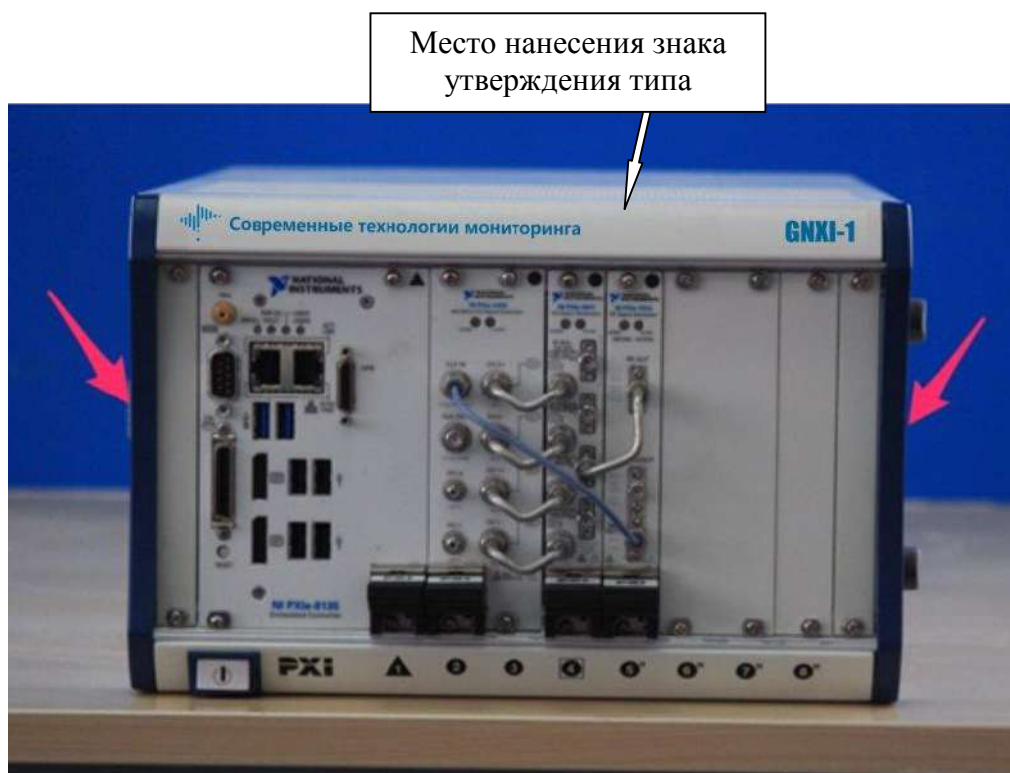
Рисунок 1 - Внешний вид имитатора GNXI-1 и места пломбировки от несанкционированного доступа и нанесения знака об утверждении типа (красные стрелки - место пломбировки)