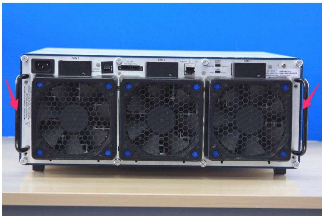
Рисунок 6 - Внешний вид имитатора GNXI-3 (задняя панель)