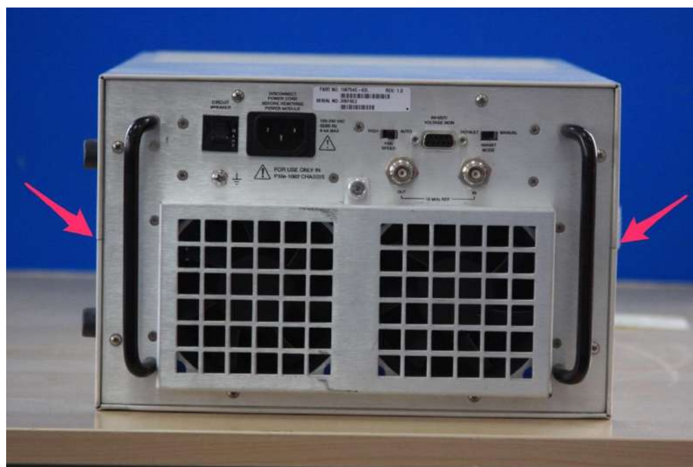
Рисунок 2 - Внешний вид имитатора GNXI-1 (задняя панель)