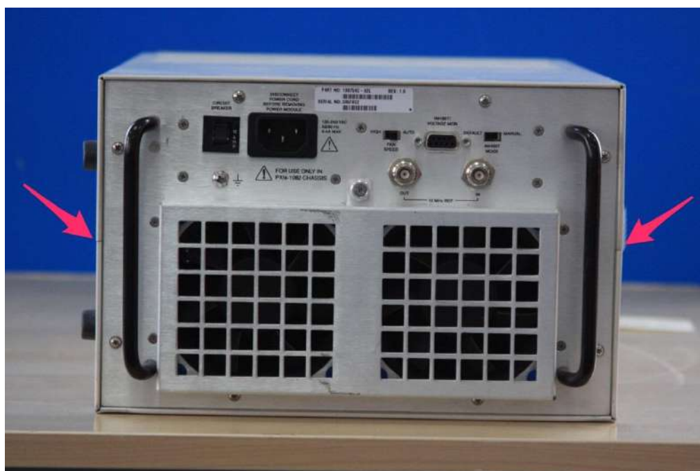
Рисунок 4 - Внешний вид имитатора GNXI-2 (задняя панель)